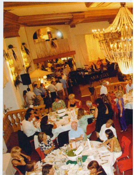
Verbot Hansi Hinterseer das Singen: Kaiser Franz