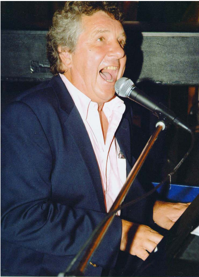
Gab sein Letztes: Michael Schanze