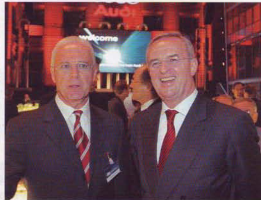
Audi-Chef Martin Winterkorn. Lukrative Verträge mit dem Sport-Prominenten.