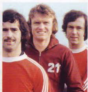
Gerd Müller (l.), Sepp Maier. Traumtrio in Diensten des FC Bayern.