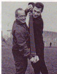
Tschik Cajkovski. Der Bayern-Trainer als früher Förderer.

Umstieg. Nach der aktiven Laufbahn gewinnt Beckenbauer 1990 als Teamchef erneut die WM. Als FC-Bayern-Präsident vollzieht er den Wandel des Clubs in eine AG – und ist als Werbefigur begehrter denn je.