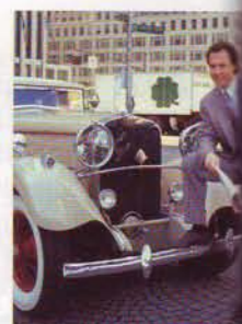
New York. Neustart der US-Fußballliga im Jahr 1977.