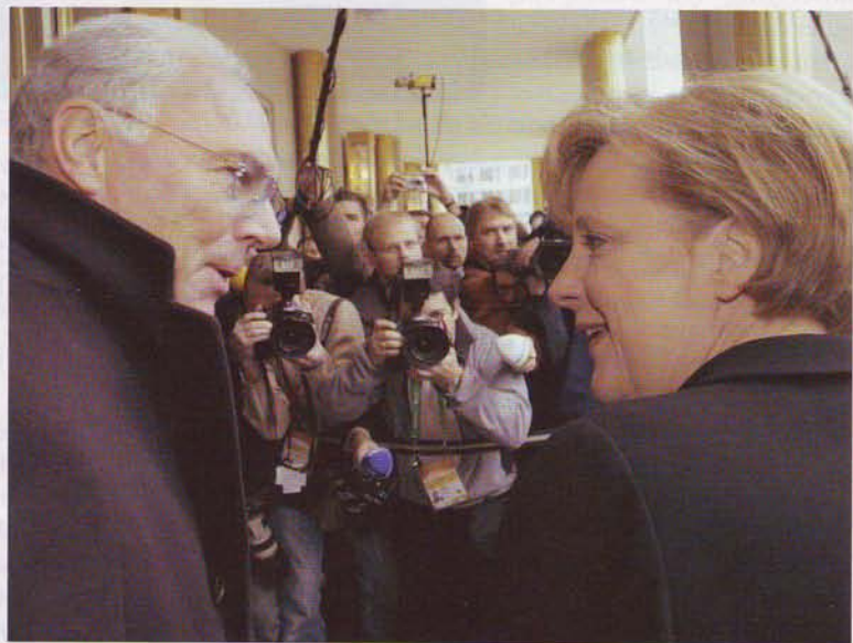
Franz Beckenbauer, Angela Merkel. Die Bundeskanzlerin hofft, dass die positive Außenwirkung der WM das ganze Land voranbringt.