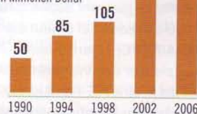
Kosten für die TV-Rechte der Fußball-WM, in Millionen Dollar

Die Einnahmen aus dem Fernsehgeschäft erreichen neue Rekordmarken.