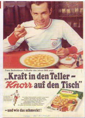
Suppenreklame. Erster Werbeeinsatz im Januar 1967 für Knorr.