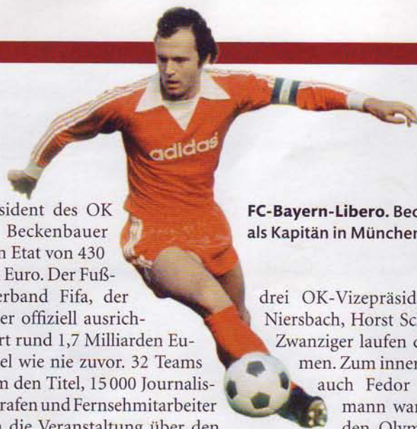
FC-Bayern-Libero. Beckenbauer als Kapitän in München.

guter Gastgeber sein. Die Leute sollen hinterher sagen: Das war eine schöne Weltmeisterschaft, die Deutschen waren nett und freundlich“, sagt Beckenbauer (siehe Interview S. 34: „Stress, was ist das?“). Es wird ihm wohl gelingen. Kein Zweifel: Beckenbauer ist der Mann des Jahres 2006, der Kapitän eines Milliardenspiels. Dabei versteht es der OK-Präsident, auch das Privatunternehmen Beckenbauer gedeihen zu lassen: „Ich hatte noch nie so viele Werbeverträge wie derzeit.“ Als einziger deutscher Sportler schaffte er es, nach seiner aktiven Laufbahn mehr als zwei Jahrzehnte im Geschäft zu bleiben und zu einer der begehrtesten Werbefiguren Deutschlands aufzurücken – zum Wohl der eigenen Kasse: Seine jährlichen Einnahmen aus diesen Aktivitäten schätzen Experten auf vier Millionen Euro, sein Vermögen auf 40 bis 50 Millionen Euro.